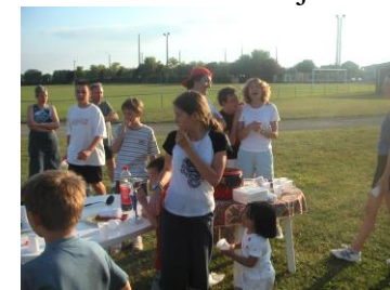
Journée portes ouvertes en juin

Tout au long de l'année, les fêtes s'enchaînent : « Raquettes / Galettes » en janvier « Fête des jeunes » en mars Fête du club en juin